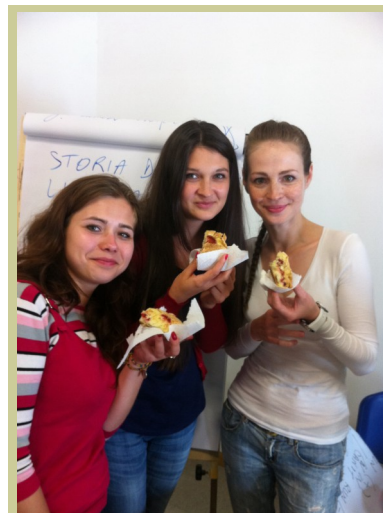
La Foto del Mese

DA University Magazine è un progetto realizzato dal CE.S.A.S.S. (Centro Studi ed Assistenza Studenti Stranieri) dell'Università per Stranieri "Dante Alighieri". Tra gli obiettivi principali vi sono la promozione dell'Ateneo e del suo territorio e l'integrazione degli studenti stranieri grazie ad attività di laboratorio pomeridiane, che consentano lo scambio interculturale anche con gli studenti dei corsi di Laurea ordinari.